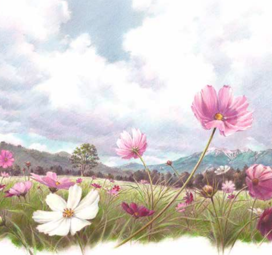
揺 yureru 鉛筆・色鉛筆